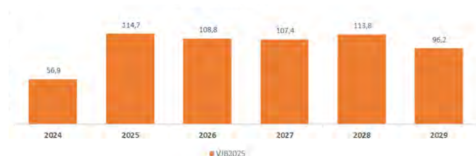
BRUTO INVESTERINGEN BEDRAGEN X € 1 MILJOEN

Hierna worden de investeringen per programma op hoofdlijnen toegelicht en gespecificeerd. Het programma besturen en belastingen is daarbij verder niet uitgewerkt. De bruto-investeringen van dit programma bedragen over de planperiode € 7,1 miljoen en bestaan voor € 5,2 miljoen uit projecten ten behoeve van informatieveiligheid (NIS2).