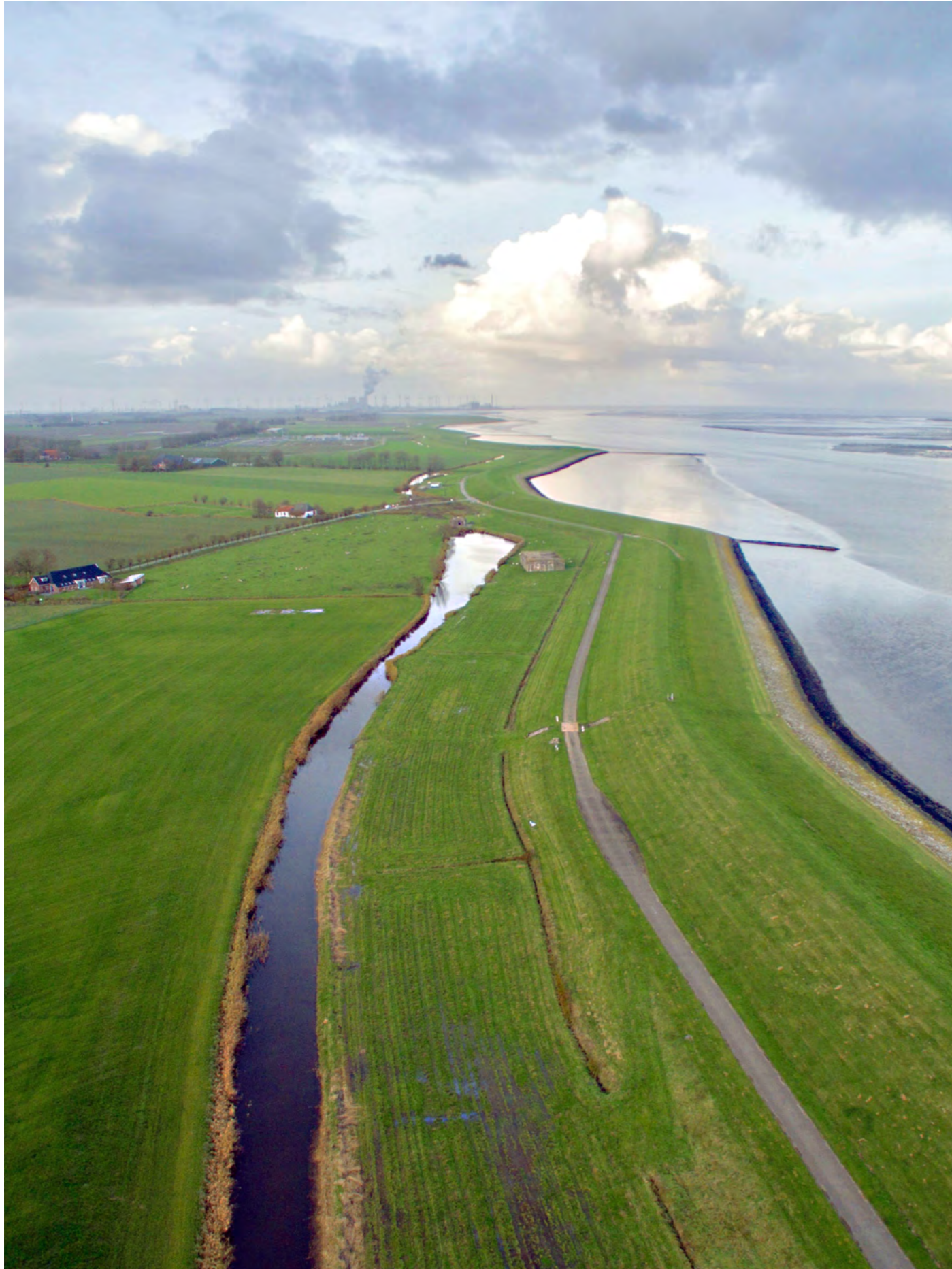
Ommelanderdiek Bocht van Watum