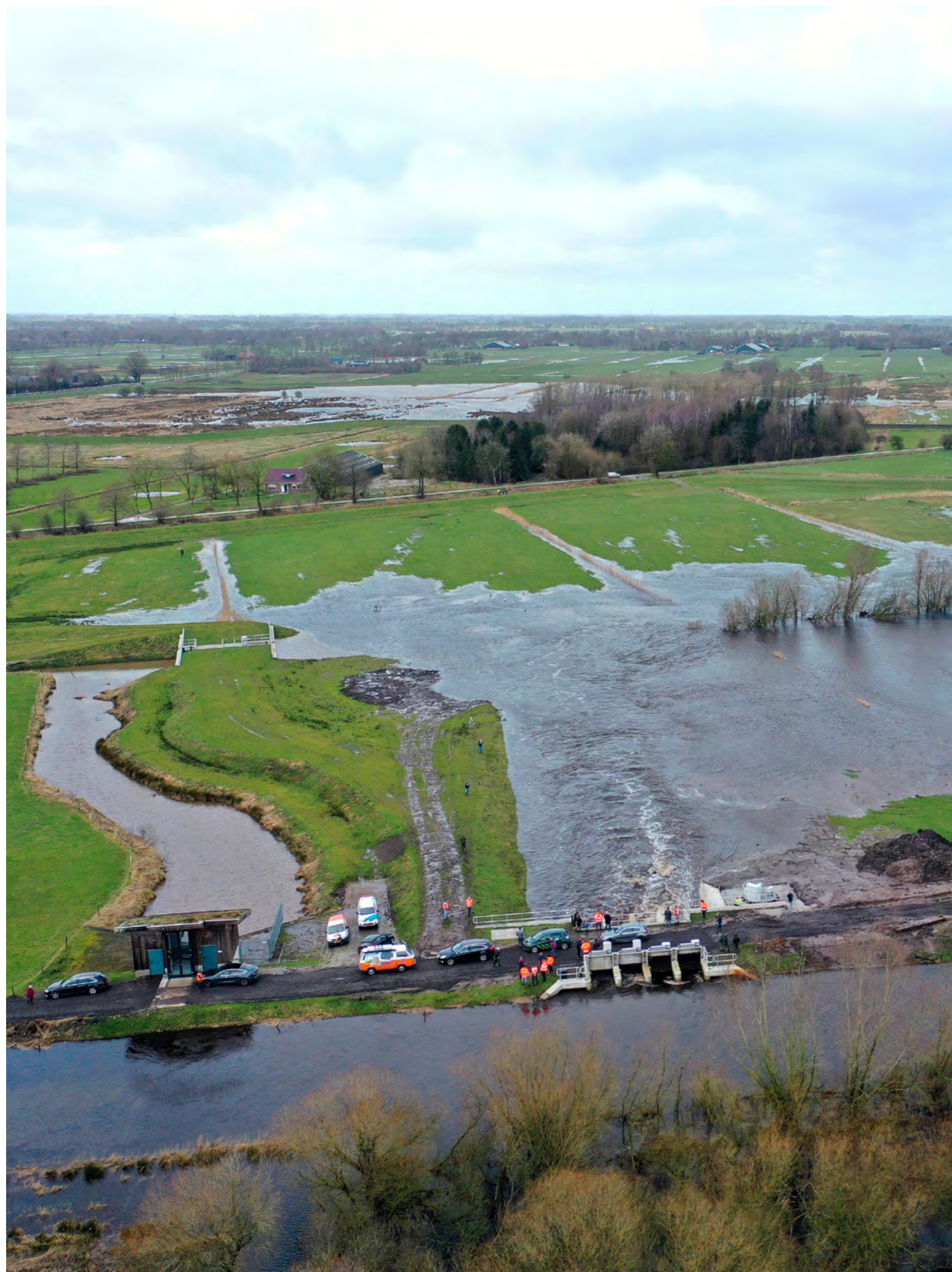
Waterberging De Dijken-Bakkerom