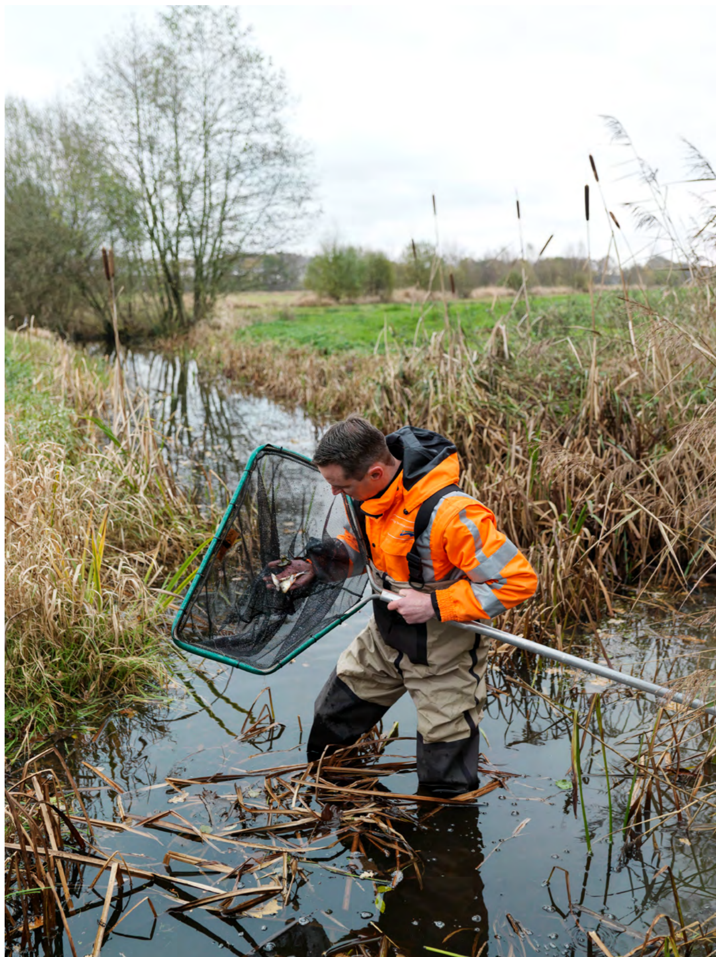
Beheer voor een goede waterkwaliteit en biodiversiteit