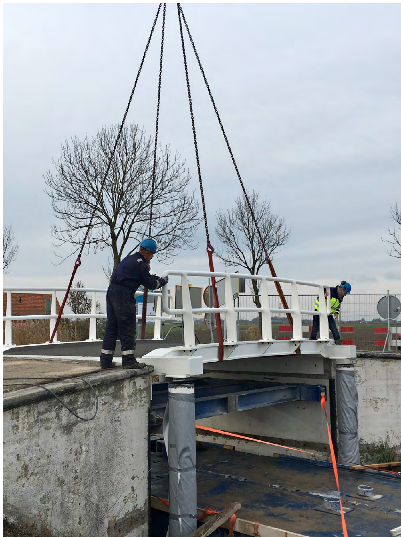
Bestaand en nieuw materiaal bij circulaire aanpak bruggen