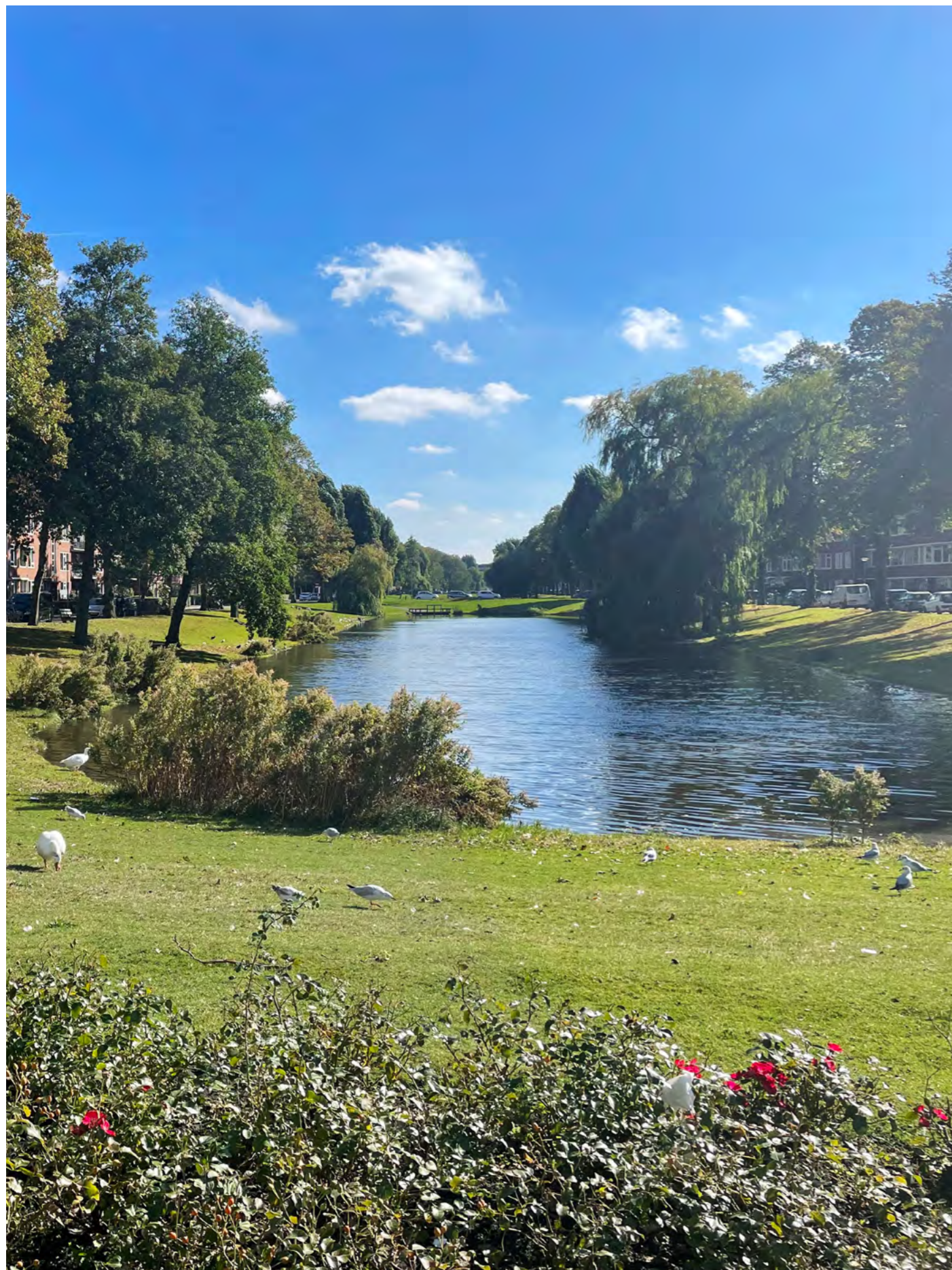
Water in de stad