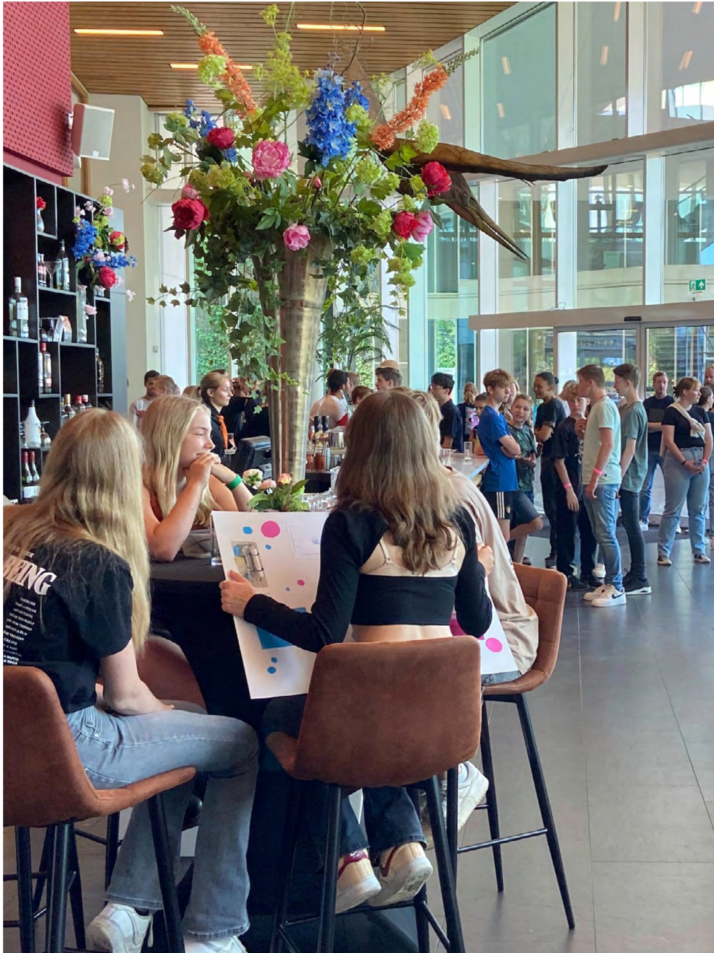
Event - Jongeren en klimaat 2023