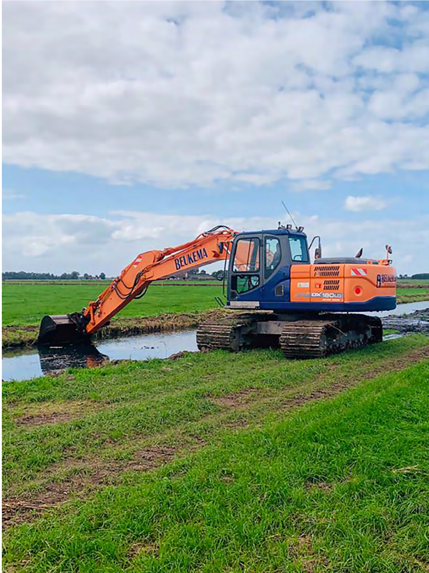
Baggeren van watergangen