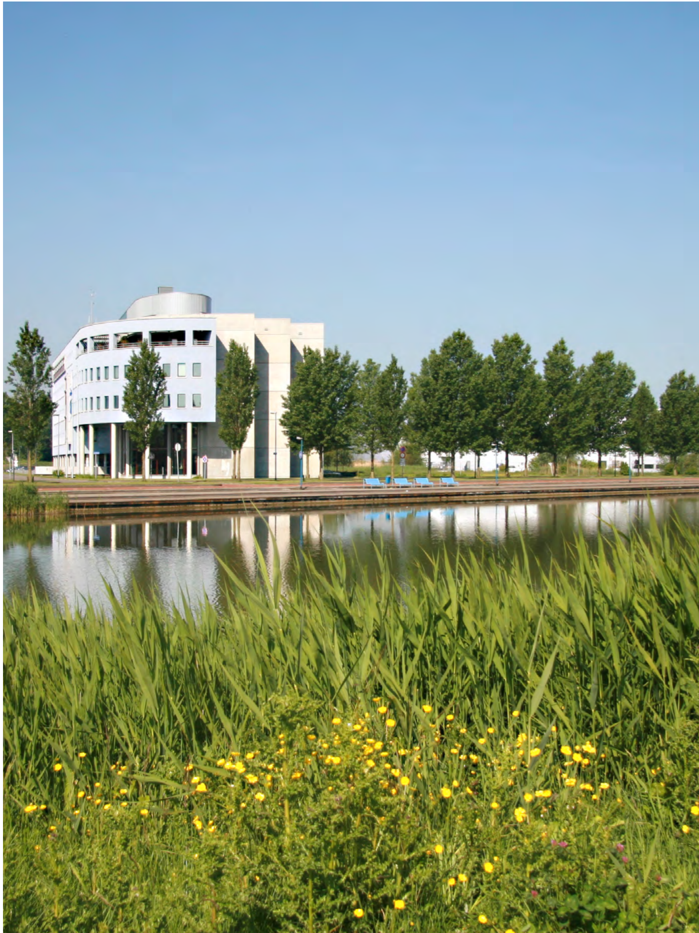
Hoofdkantoor Waterschap Noorderzijlvest