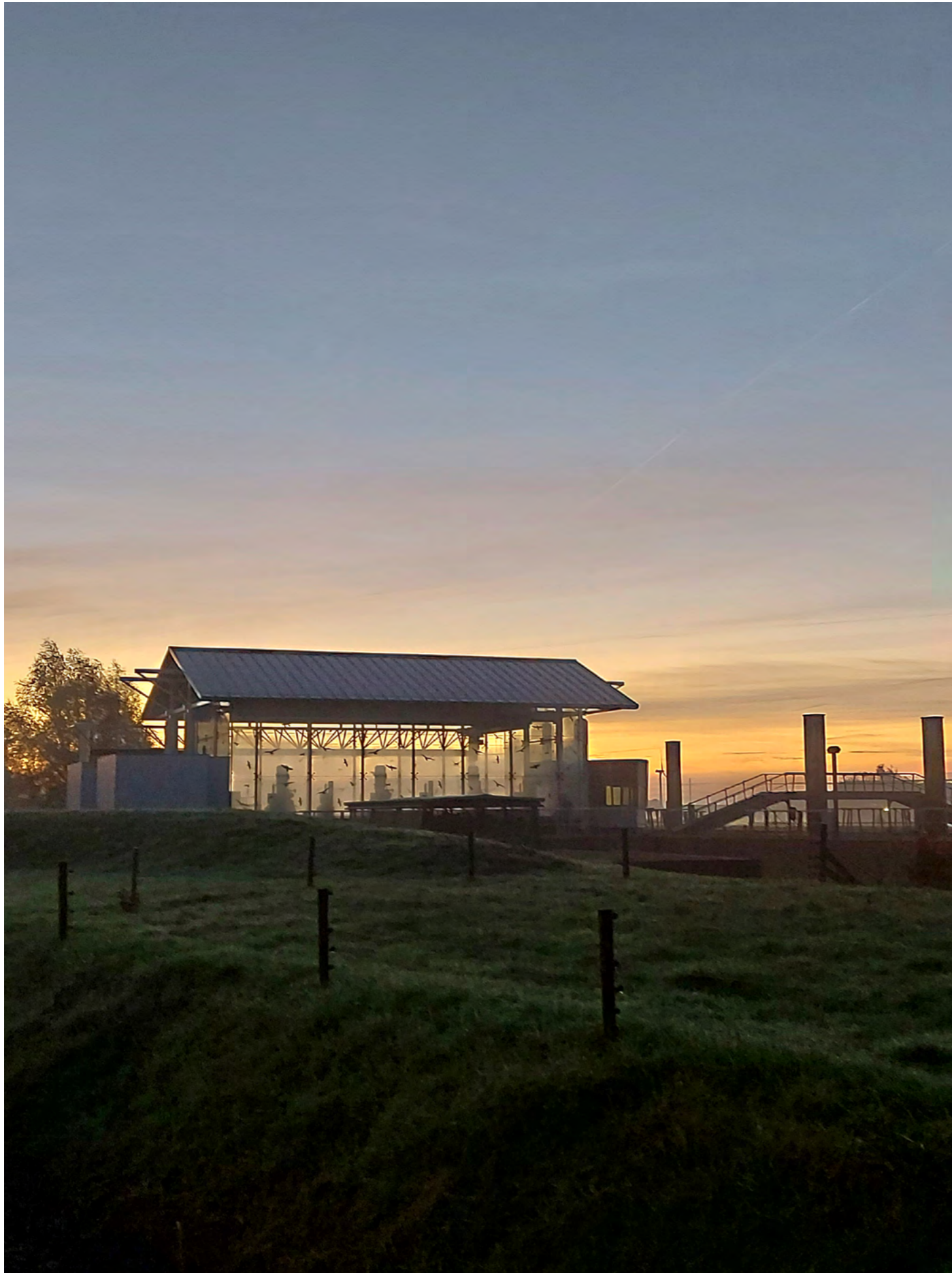
Gemaal Den Deel aan het Boterdiep