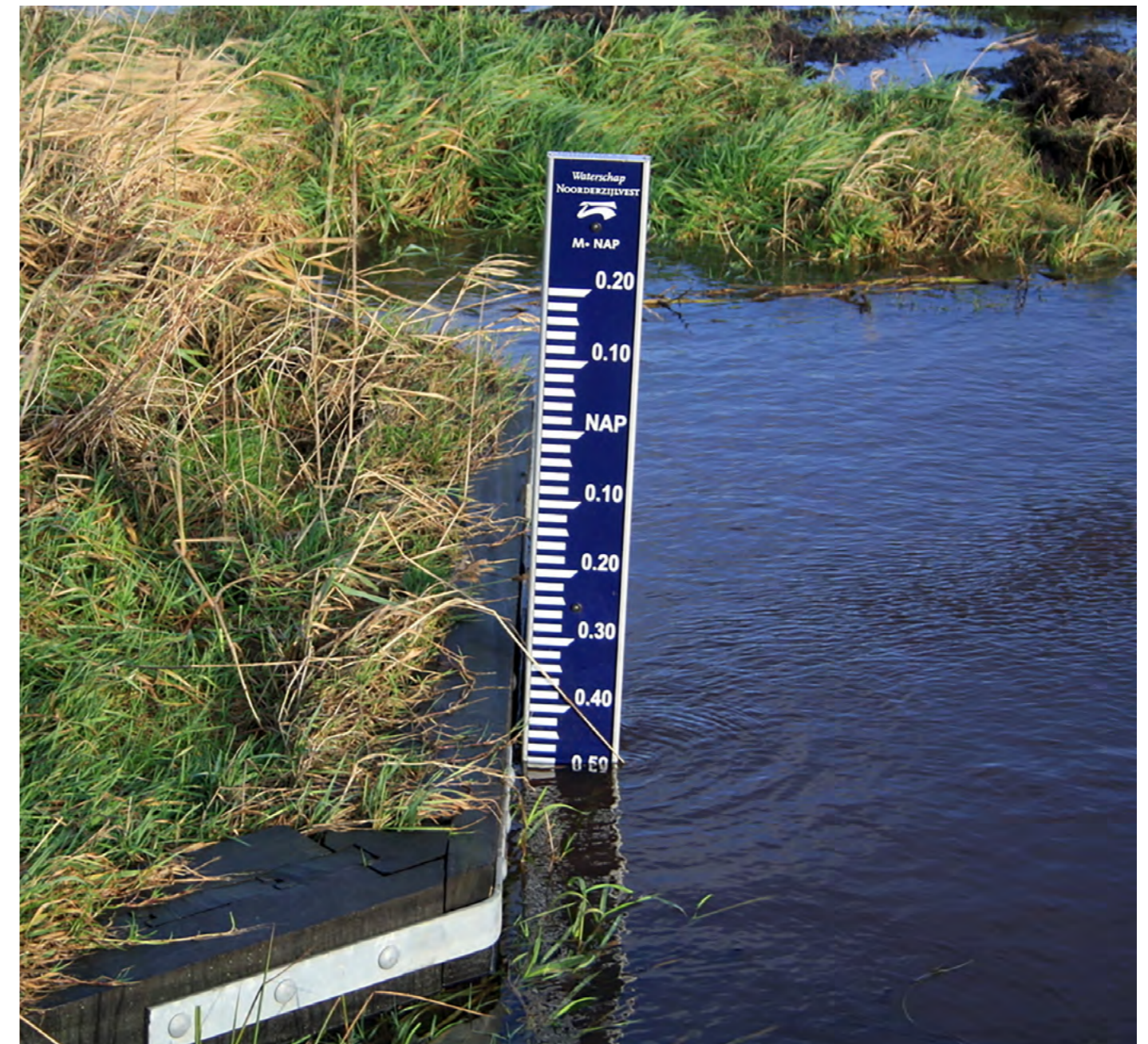
Peilschaal omgeving Roderwolde