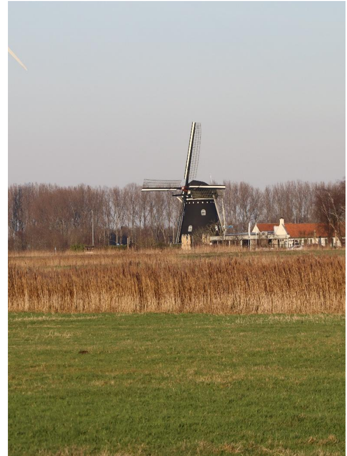
Foto Hiernaast is de Zwartebergse molen te Etten-Leur, eigendom van het waterschap.