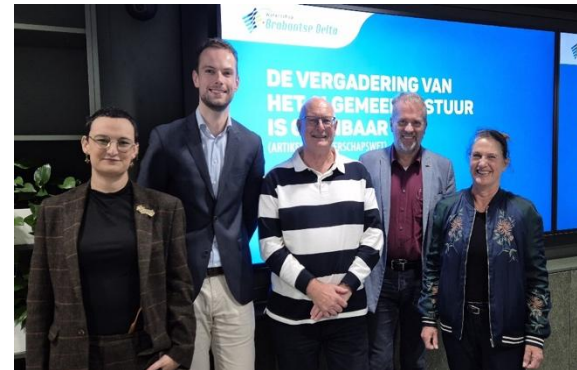
Fractie Water natuurlijk Brabantse Delta