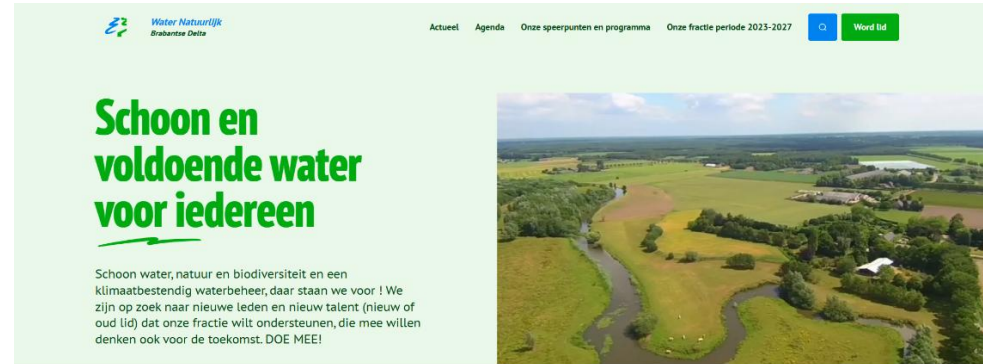
Screenshot van de website Water Natuurlijk Brabantse Delta